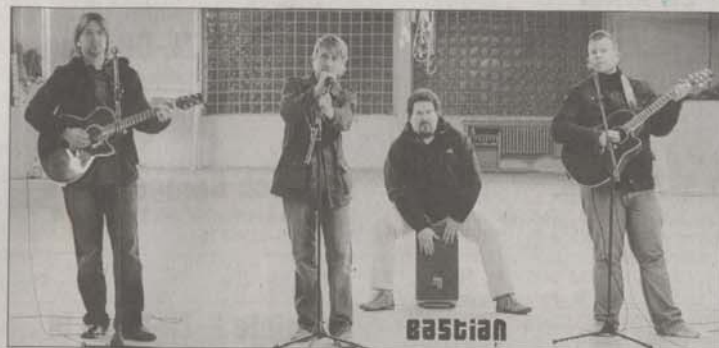
„Musik zum Anfassen“ gibt es mit der Gruppe Bic Mac Acoustic Rock am Freitag.

Zum Mittagstisch am Sonntag gibt es außer Rote vom Rost ein Angebot von Schnitzel und Krustenbraten mit Salat und Pommes sowie Salatteller. Zur Kaffeetafel steht am Nachmittag ein großes Kuchenbuffet bereit. Alle Gerichte sind auch zum Mitnehmen. Außerdem ist wieder, wie in den letzten Jahren, an allen drei Tagen die Bar geöffnet. Der Eintritt ist an allen drei Tagen frei.