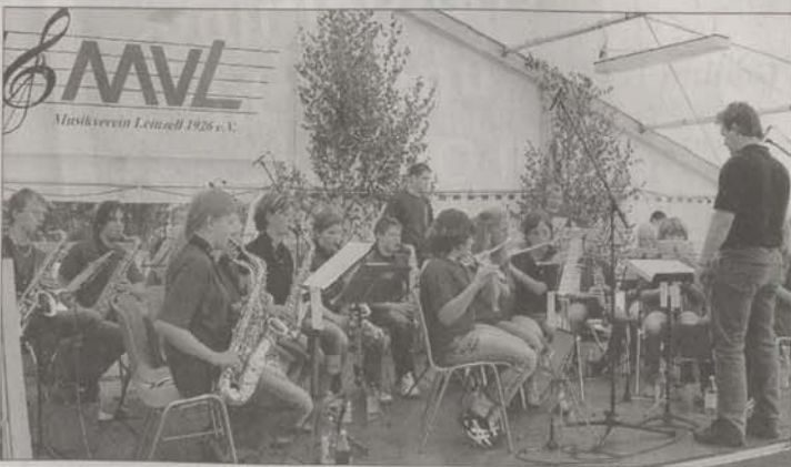
Die Jugendkapelle aus Leinzell sorgt zur Kaffeestunde für musikalische Unterhaltung.

Neugierig? Tel. 07175/8656 Od. mehr Information unter www.jakob-reisen.de